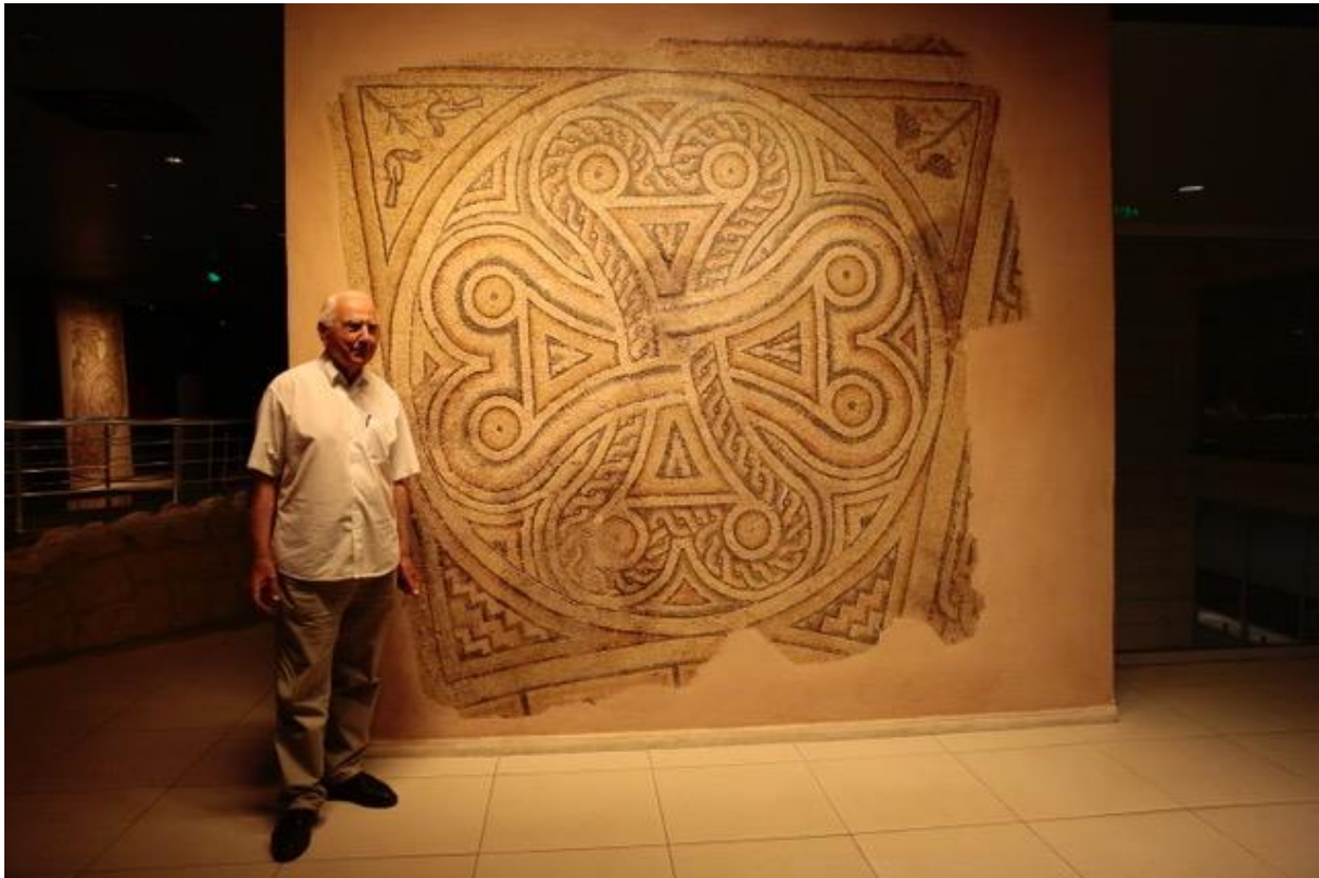
Mosaik aus Zeugma im Museum von Antep

Unterhalb des Staudamms ist der Euphrat ein ruhiger breiter Fluss. Ähnlich wie in Van die fast ausgestorbenen Van-Katzen (ein Auge grün, das andere hellblau, die Katzen schwimmen) wird hier versucht, den Zugvogel Ibis zu retten. Durch den Stausee ist Bewässerung möglich, die Landwirtschaft ist aufgeblüht, die Pestizide haben die Insekten vernichtet. Mangels Nahrung gab es zu Beginn des Jahrtausend nur noch elf Exemplare, jetzt wieder 200 in einer riesigen Voliere, werden immer wieder freigelassen, z.B. im Frühjahr, wo sie die Mandelblüten befruchten, kehren zur Nahrungsaufnahme immer wieder in die Voliere zurück. Mittagessen in Birecik am Euphrat. Jetzt ist in Antep das größte Mosaikmuseum der Türkei (der Welt?). Mit den Planungen für den Staudamm wurde die griechische Stadt Zeugma entdeckt und die Mosaik ins Museum gebracht. Herrliche Tier und Menschen Szenen bis zur Christianisierung, in den Kirchen dann nur herrliche Ornamente, keine Bilder!