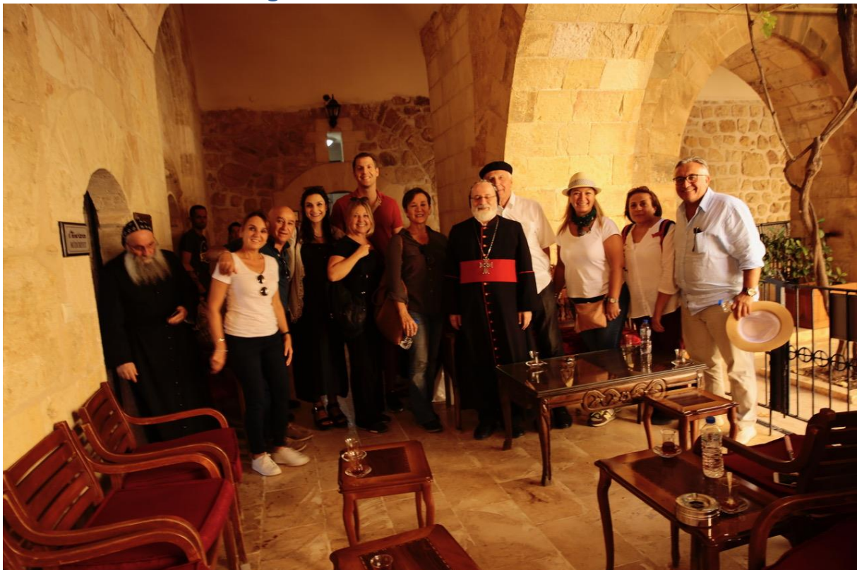
Besuch beim Metropoliten Saliba

zantinischen) Stadt, Festung gegen die Perser im benachbarten Nisibis, an dem wir nur vorbei gefahren sind. Die Römer (Byzanz) hatten die syrisch-orth Christen dieser Gebiete verfolgt, „aber Gott sandte die Kinder Ismaels, uns aus den Lügen und dem Morden der Römer zu befreien“ schrieb der syrische Metropolit von Dara Oğuz Dara-Anastasiupolis, als die Araber die Festung 639 zerstört hatten. Auch den Staudamm und die riesige Zisterne besichtigten wir und nahmen eine Weinprobe aus den syrischen Gärten. Die Ausgrabungen legten in der Tiefe eine Menge von menschlichen Gebeinen frei, gut zu sehen unten den Glas-Laufstegen. Die Erläuterungstafeln nennen die Gebeine die Toten der Eroberung, berichten aber auch ausführlich, dass nach der örtlichen Tradition der Prophet Ezechiel hier in Dara die Vision hatte, die er im 37. Kapitel beschreibt. Die Hand des Herrn legte sich auf mich und der Herr brachte mich im Geist hinaus und versetzte mich mitten in die Ebene. Sie war voll von Gebeinen. So spricht Gott, der Herr, zu diesen Gebeinen: Ich selbst bringe Geist in euch, dann werdet ihr lebendig.